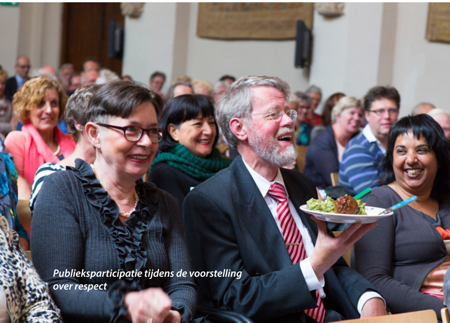
Publieksparticipatie tijdens de voorstelling over respect

Die onwennigheid van sommige klanten betekent dat er eerst vertrouwen moet komen. "Als mensen bij mij komen stel ik ze eerst gerust." »