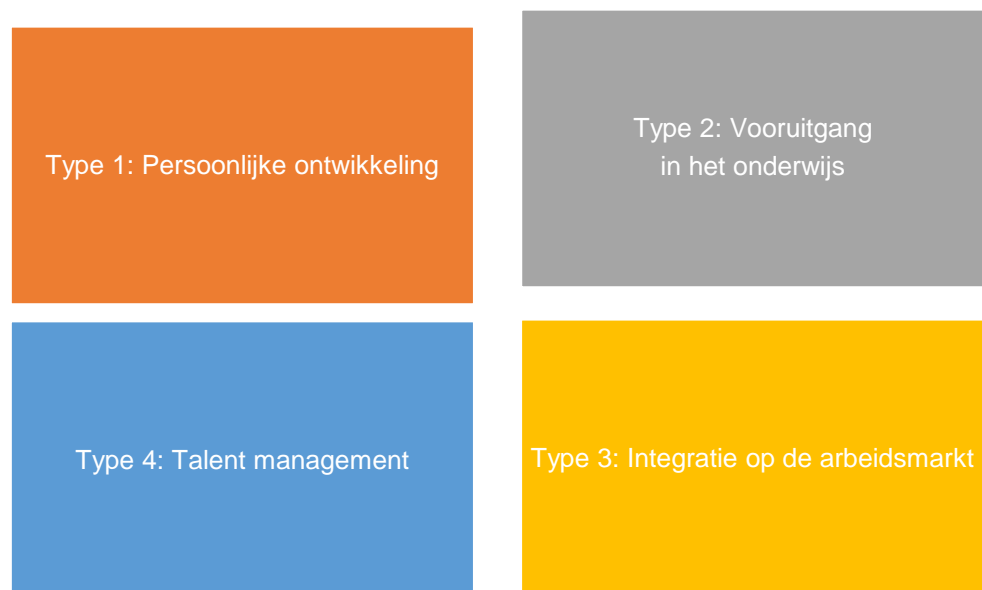
Afbeelding 1: Typologie van skillsaudits

Het onderzoek heeft geleid tot een typologie van skills audits, die relevant is voor de conceptuele ordening van het type skillspaspoorten (zie afbeelding 1). Op de volgende pagina's wordt een overzicht gegeven van een aantal globale kenmerken en voorbeelden per type audit.