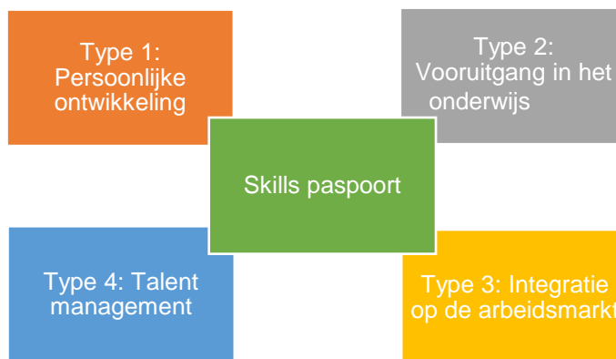
Afbeelding 2. Het skillspaspoort in relatie tot de vier typen skills assessment

Het is interessant de intenties en doelstellingen van een skillspaspoort te koppelen aan deze typologie van skillsaudits. Allereerst kan worden gesteld dat het skillspaspoort in de meest ambitieuze, onderwijs/arbeidsmarktbrede variant alle vier de typen skills audits integreert, zie afbeelding 2. Dat wil zeggen dat het skillspaspoort in zijn ideale of beoogde vorm de belangrijkste doelstellingen van de vier soorten skillsaudits nastreeft: versterken van het zelfbewustzijn (type 1), faciliteren en versnellen van scholingsroutes (type 2), bemiddeling en matching (type 3) en in-door-uitstroom van personeel (type 4).